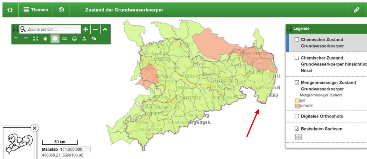
Abbildung 2: Zustand der Grundwasserkörper in Sachsen 3

Es ist zu erwarten, dass der Klimawandel diese quantitativen Probleme weiter verschlimmert. 4 Niedrigwasserereignisse der Lausitzer Neiße nehmen bereits jetzt schon an Dauer und Häufigkeit zu. 5